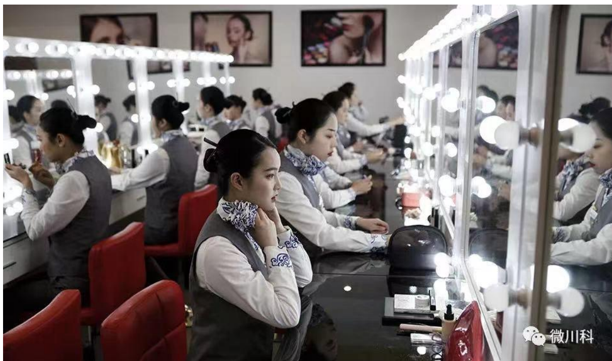
图4教学改革后的职业形象实训课