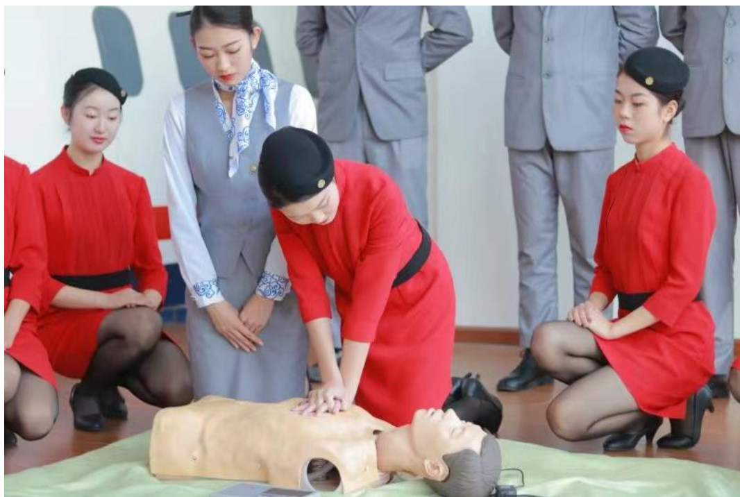
图11学生参加红十字会急救培训，并全员通过考试