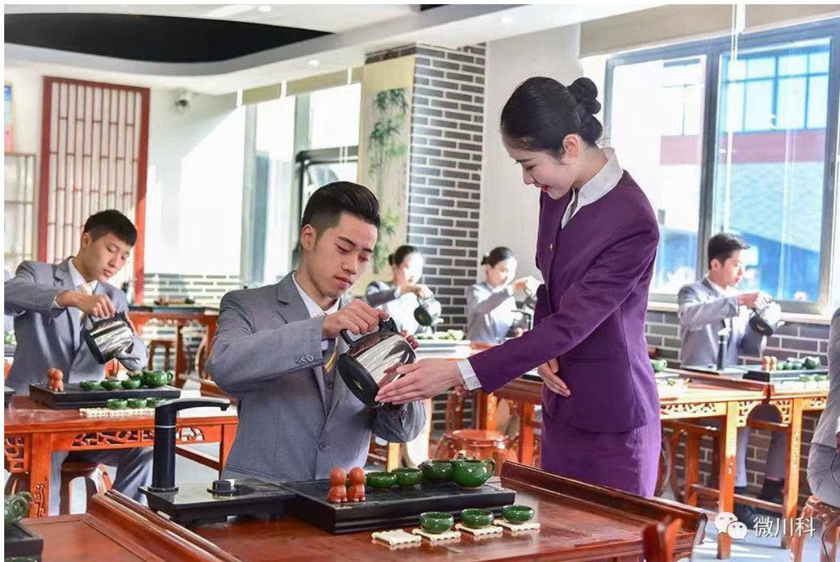
图13教学改革后的茶艺实训课