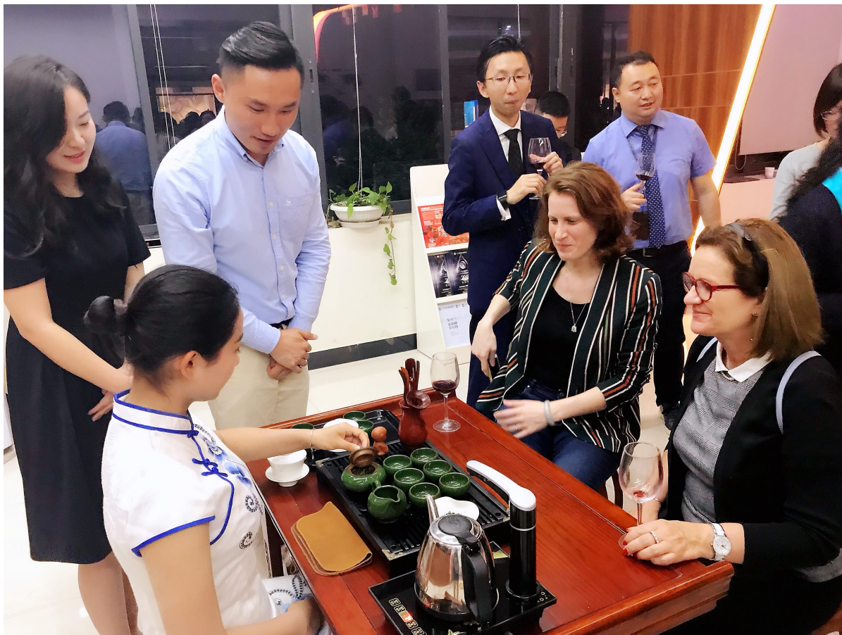
图9空乘专业学生为法国驻成都总领事展示茶艺礼仪