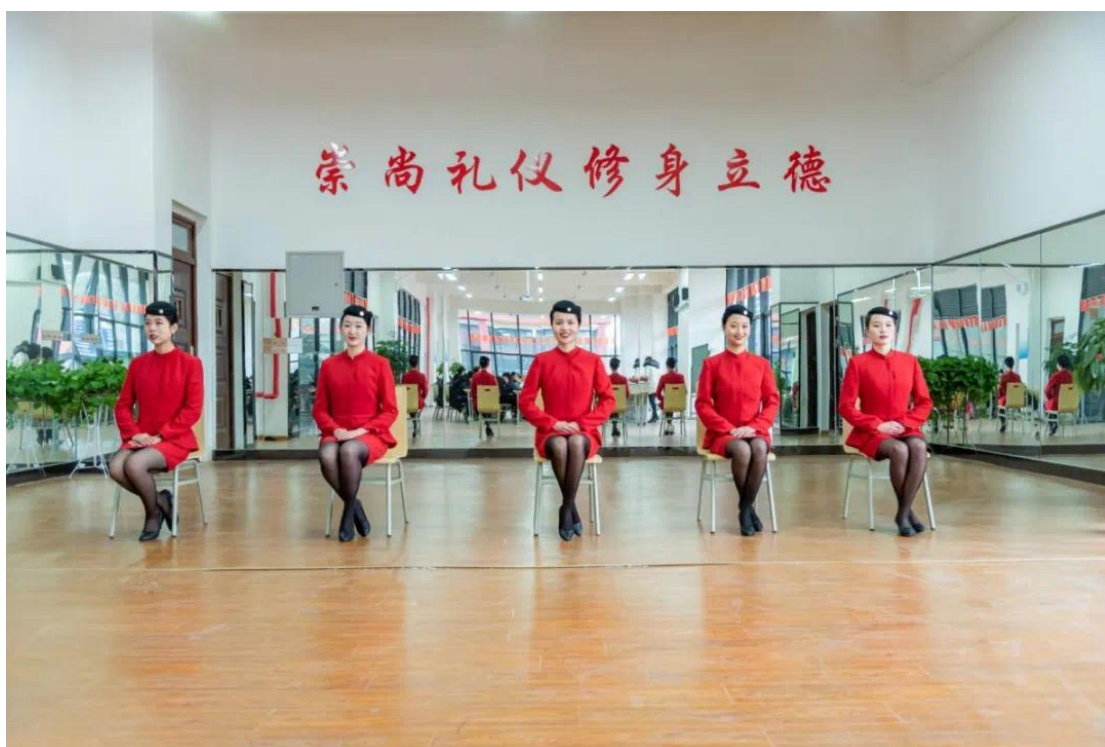
图2 教学改革后的礼仪实训课