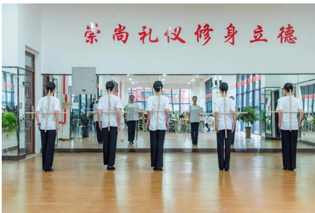
图1 教学改革后的形体礼仪实训课

以校园文化为载体，拓展空乘专业学生的行为素质能力。加强空城学生的日常管理，为了提升空乘学生的职业形象，每日学校都会对空乘专业学生的着装、仪容仪表、形体仪态等方面进行标准化的规范和要求。要求学生每日上课期间，应准时到达教室，养成良好的习惯。同时，要求空乘专业大学生坚持每日做礼仪操，形成良好的行为习惯。