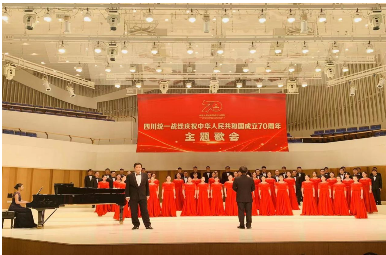
图5 我校空乘专业学生代表参加四川统战部庆祝中华人民共和国成立70周年主题歌会获得副省长杨兴平夸赞