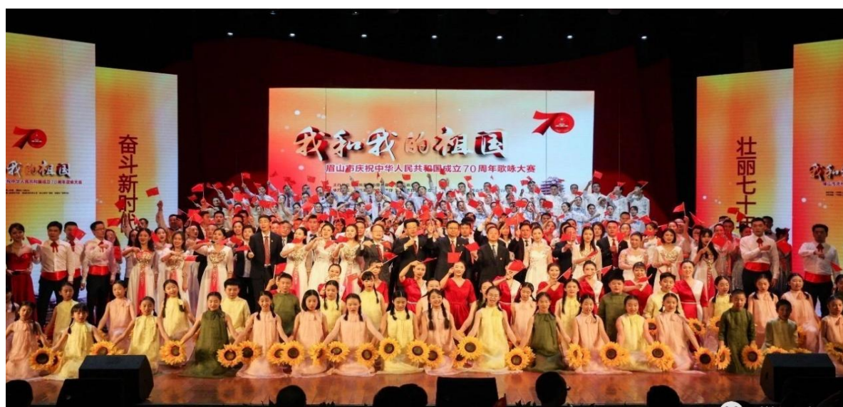
图6 我校空乘专业学生担任眉山市庆祝中华人民共和国成立70周年歌咏比赛礼仪获得时任眉山市委书记慕新海肯定