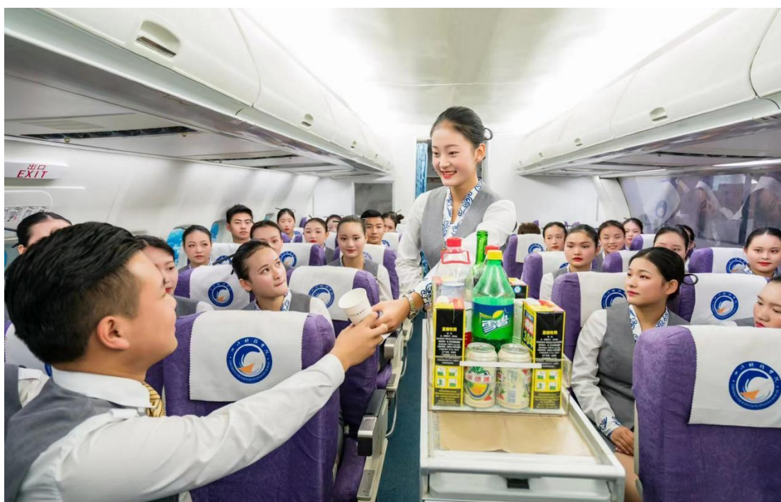
图12空乘专业学生在模拟舱进行实操演练