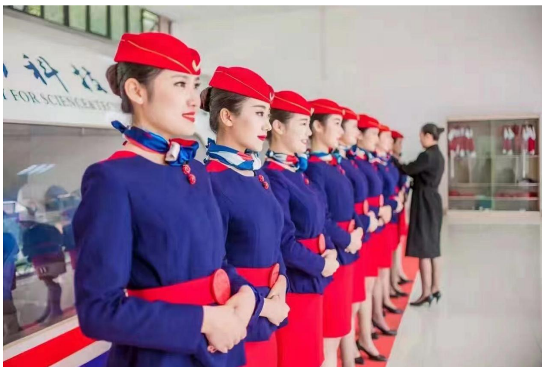
图3 教学改革后的礼仪实训课