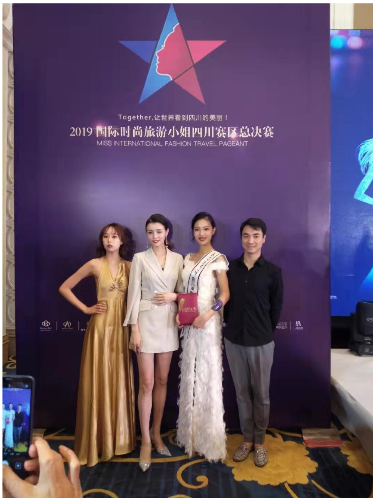
图10空乘专业学生参加2019国际时尚旅游小姐四川赛区总决赛,获得三等奖及最佳时尚奖