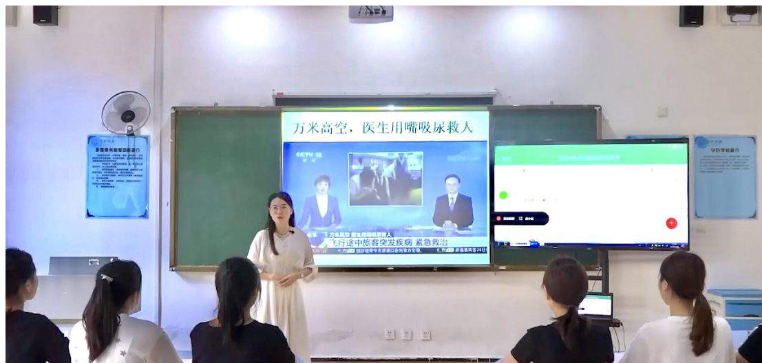
图为团队教师在进行理论课讲授

通过线上线下做题和实训考核等，对效果进行了测评，结果较令人满意。通过问卷调查，得出我们的教学方式方法也获得学生一致认可的结论。