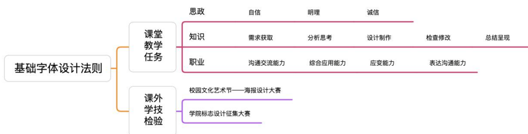
图 2 教学实施框架