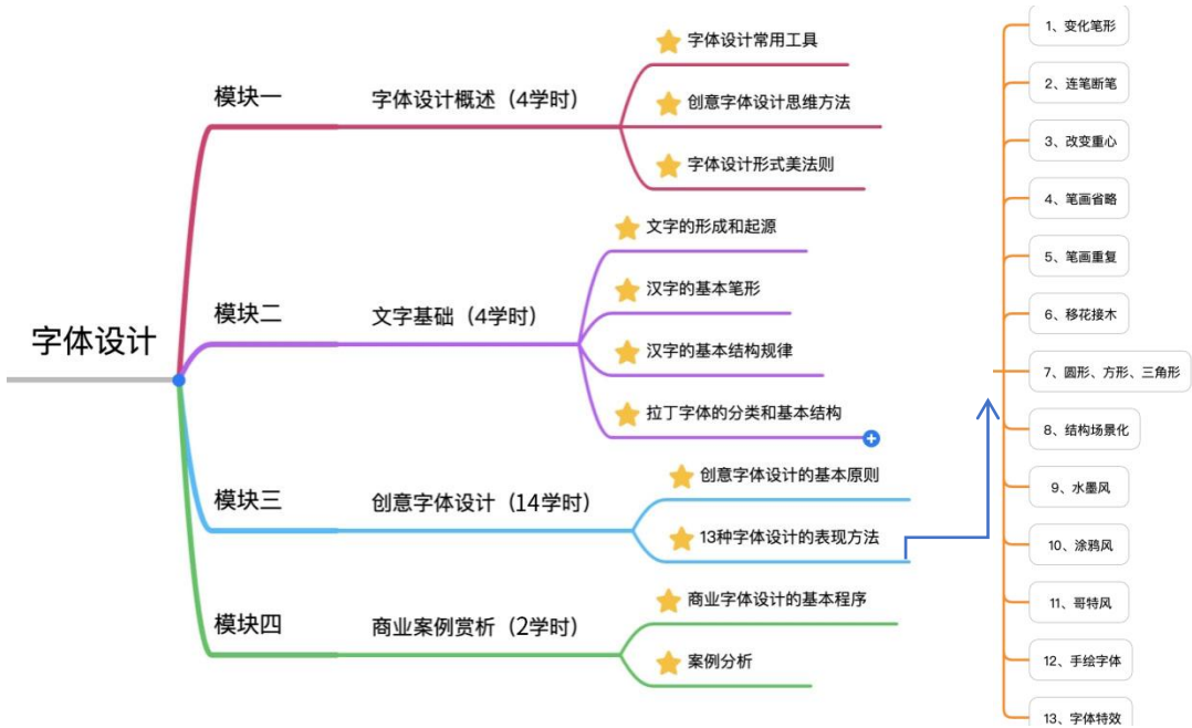
图 1 字体设计教学内容重构

和模块二的教学内容以讲授字体基础知识为主要内容，教学以讲授为主，练习为辅，模块三的教学内容则主要以 13 种创意表现方法为主，讲练结合，让学生能够掌握各类字体设计的方法，并且能够储备一定的设计作品。整体教学流程为：1、讲授与演示；2、案例分析；3、学生设计；4、作业修改与讲评。