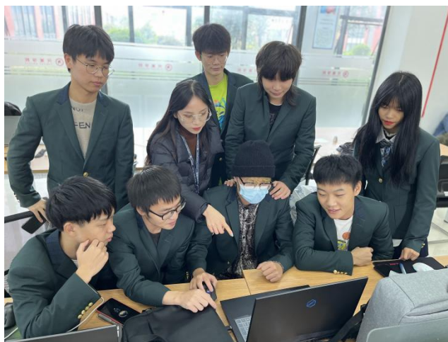
图5 分组讨论 教师指导

将班级成员以分组的方式形成团队，锻炼学生的沟通交流、协作协调能力，以互助的方式共同学习知识点、演练技能实操，使用教师自编的教材，按设计任务和过程完成工作任务，并做好过程记录，学生职业能力螺旋上升。